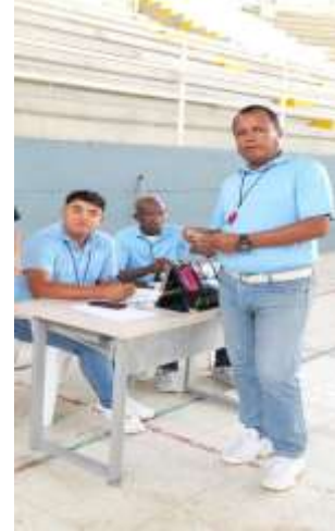
Juzgamiento De Los Encuentros Deportivos De La Disciplina Deportiva De Voleibol (Terna Arbitral).