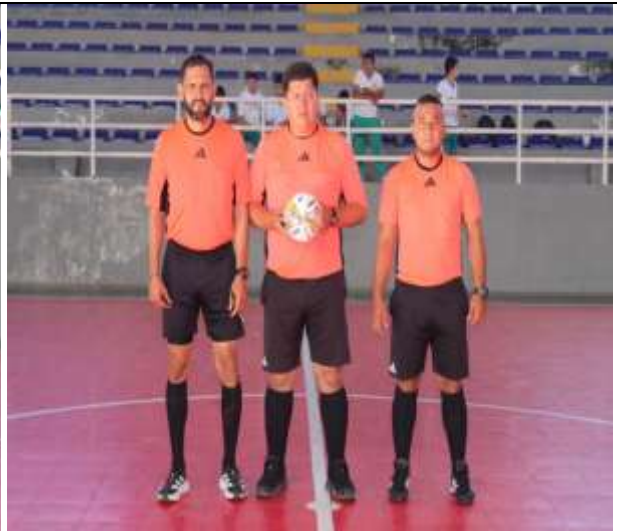
Juzgamiento De Los Encuentros Deportivos De La Disciplina Deportiva De Futbol Sala (Terna Arbitral).