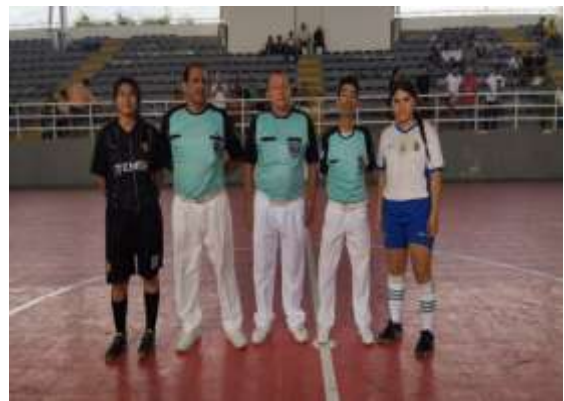
Juzgamiento De Los Encuentros Deportivos De La Disciplina Deportiva De Futbol De Sal3n (Terna Arbitral).