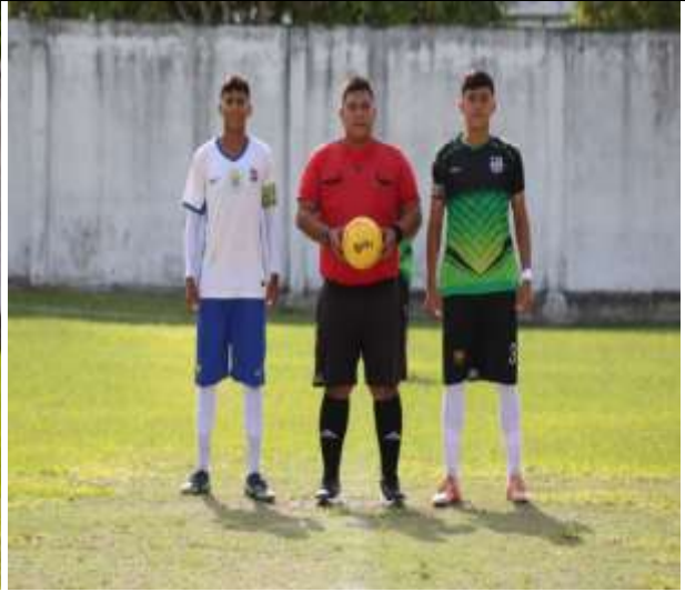
Juzgamiento De Los Encuentros Deportivos De La Disciplina Deportiva De Futbol (Terna Arbitral).