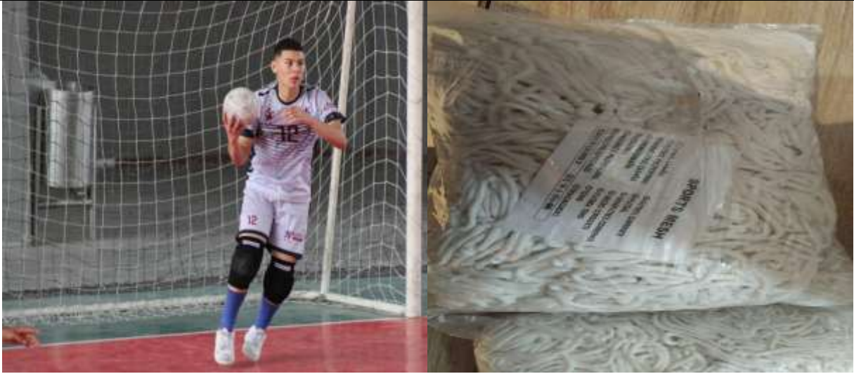
Juegos De Mallas Para Futbol De Sala Tipo Cabaña En Hilo Terlenca N°5. Inmunizada En Silicona.