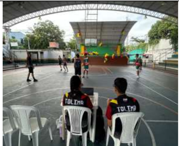
Juzgamiento De Los Encuentros Deportivos De La Disciplina Deportiva De Baloncesto (Terna Arbitral).