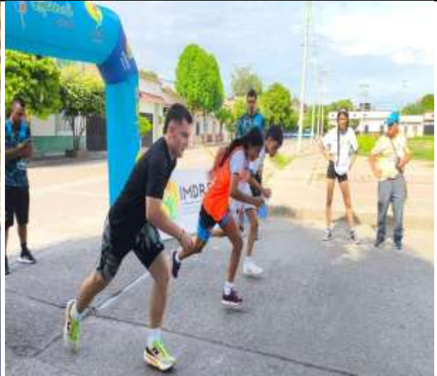
Juzgamiento Deportes Individuales Juegos Inter Colegiados 2026.